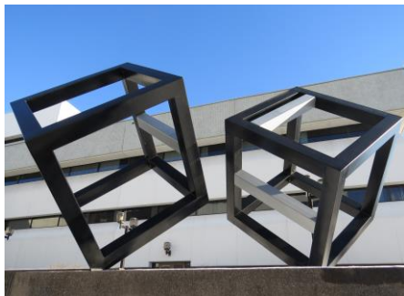
Le couple", 1978, Université du Québec à Trois-Rivières

Intendant du Pavillon Benjamin Sulte / UQTR